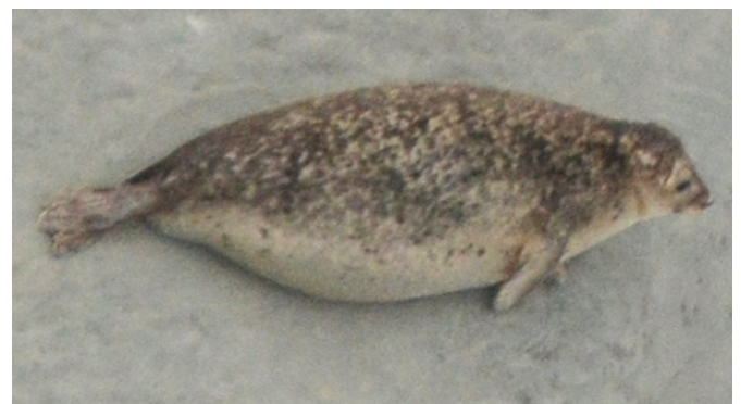
lota gestante en juillet 2025. Ce veau-marin femelle s'est échoué à la naissance, a été soigné puis relâché en baie en 2014.