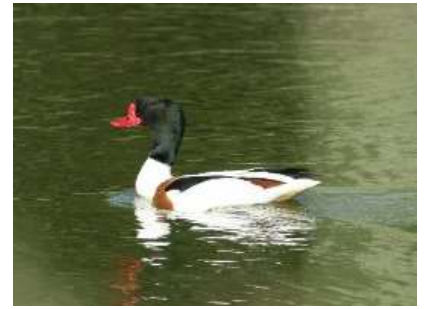
Tadorne de Belon

L'anse de Moidrey et les berges du Couesnon sont devenues très attractives pour les oiseaux nicheurs, en particulier les passereaux des roselières (7 espèces et ~300 couples, dont 150 couples de Rousserolle effarvate et 40 couples de Gorgebleue à miroir ), les espèces prairiales (3 espèces et ~40 couples) et les Rallidés (3 espèces et ~15 couples).