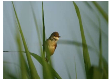
Rousserolle effarvate