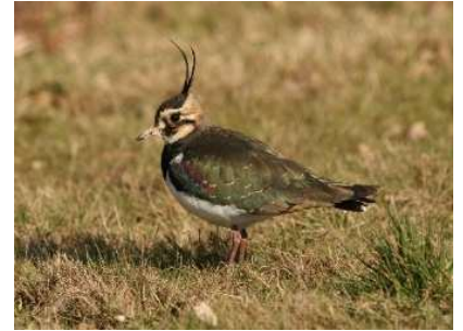
Vanneau huppé