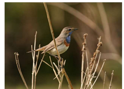
Gorgebleue à miroir