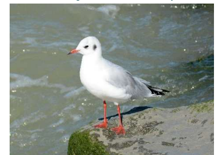
Mouette rieuse

SUIVI DE L'AVIFAUNE DANS LA PETITE BAIE DU MONT-SAINT-MICHEL Établissement public du Mont-Saint-Michel - 16 route de La Caserne - 50170 Beauvoir. Tél : 02 33 89 01 01 – courriel : etablissement.public@montsaintmichel.gouv.fr. Rédaction : Biotope. Référence : Biotope, GONm, Bretagne Vivante, 2026. Suivi de l'avifaune dans la petite baie du Mont-Saint-Michel. Année 2025. Fiche de synthèse. Établissement public du Mont-Saint-Michel. 2p.