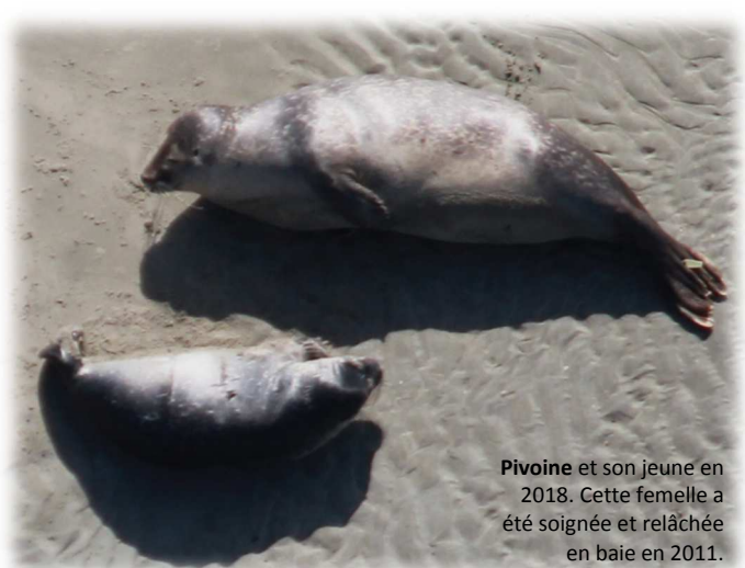
Pivoine et son jeune en 2018. Cette femelle a été soignée et relâchée en baie en 2011.