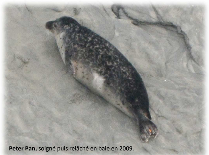
Peter Pan, soigné puis relâché en baie en 2009.